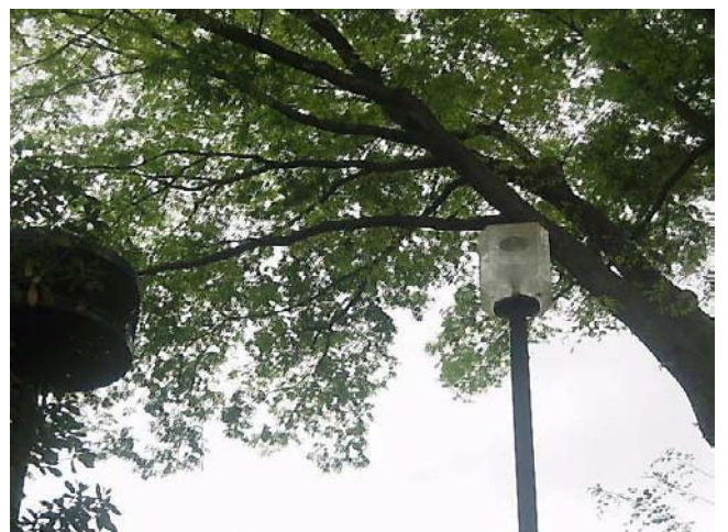
神代植物園正門付近にて