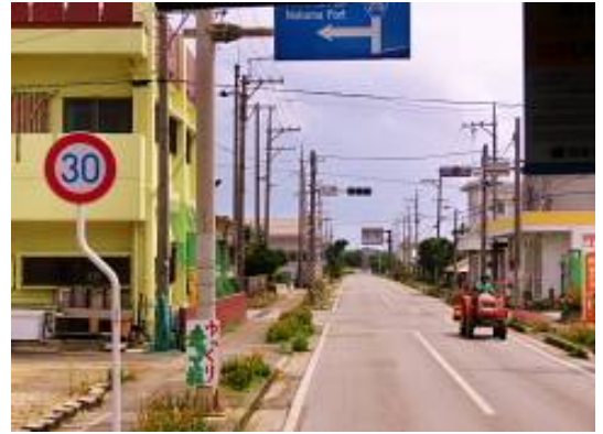
日本最南端の西表島唯一信号機