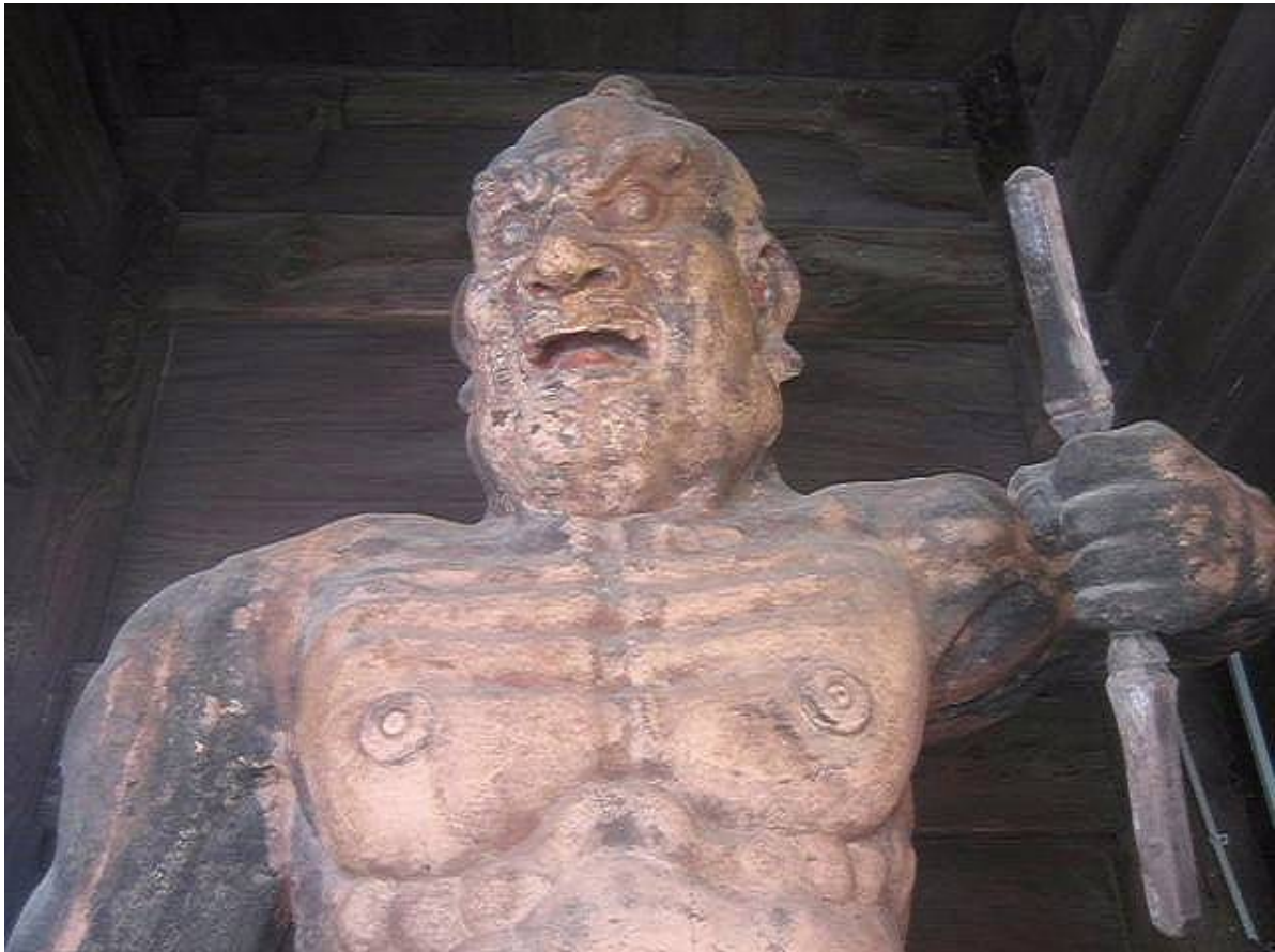
国重要文化財仁王門の阿形像

4月下旬圏央道を利用して東京、埼玉を訪問しました。 塩舟観音寺は真言宗醍醐派の別格本山で室町時代後期に建てられた本堂、阿弥陀堂、仁王門は国の重要文化財に指定されている。 都立神代植物公園は武蔵野の面影が残る都内最大の植物公園です。