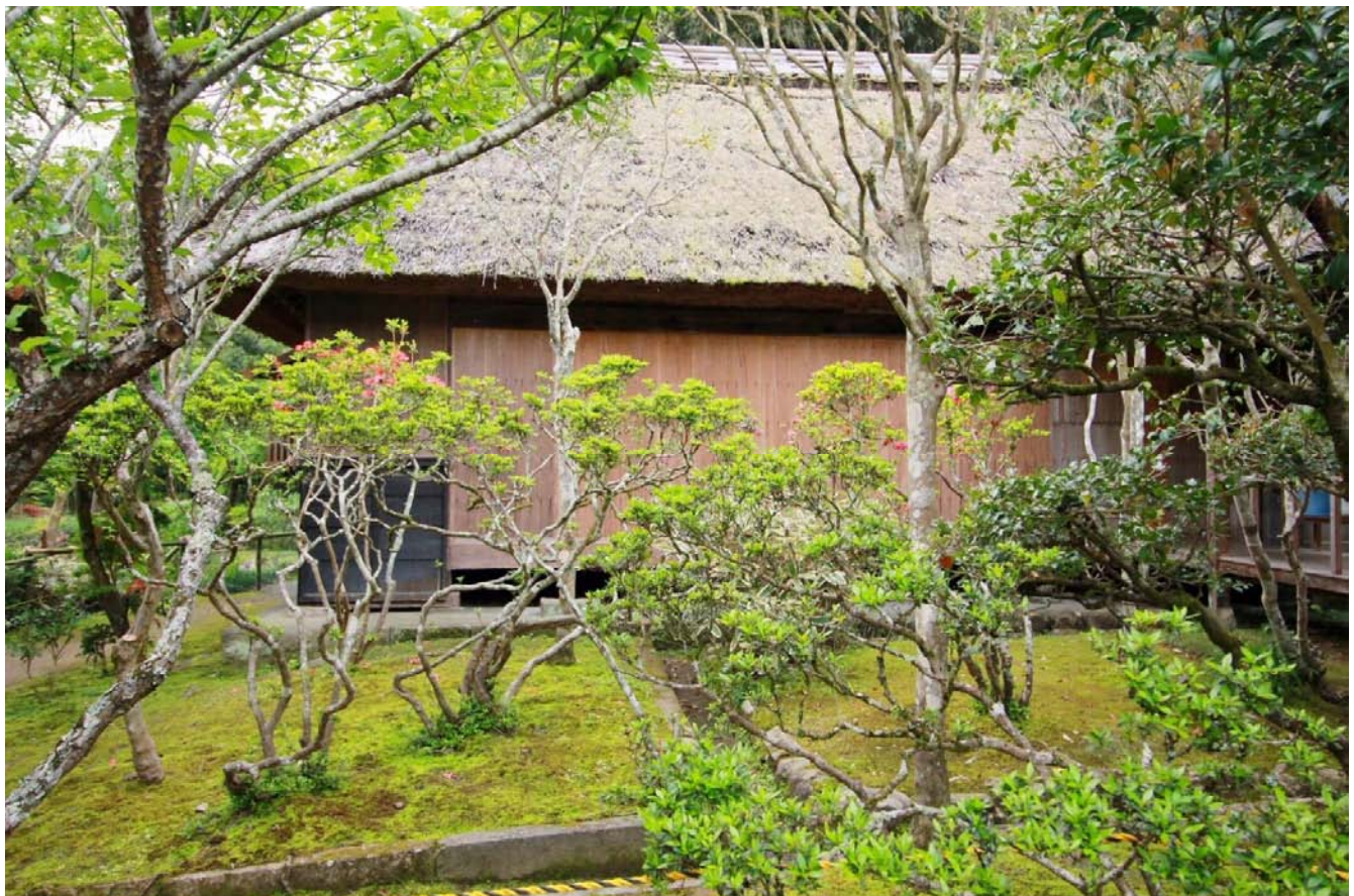
修善寺の江川家（江戸時代の武家屋敷）