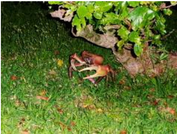
20センチ以上ある蟹と遭遇