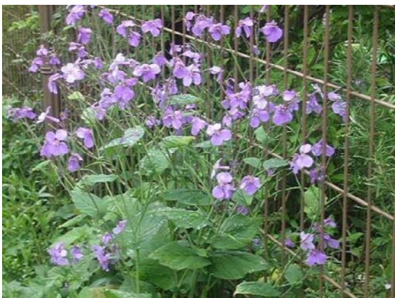
塩船観音寺駐車場付近に