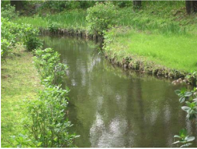
神代植物公園せせらぎの小路