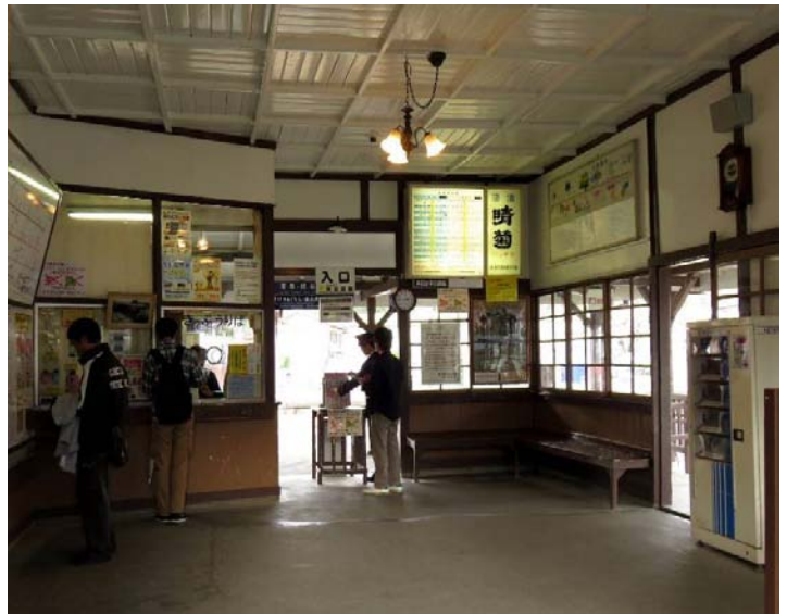
レトロな雰囲気の中長瀨駅と岩が連なる石畳・宝登山の山頂は桜とツツジが咲き誇っていた。