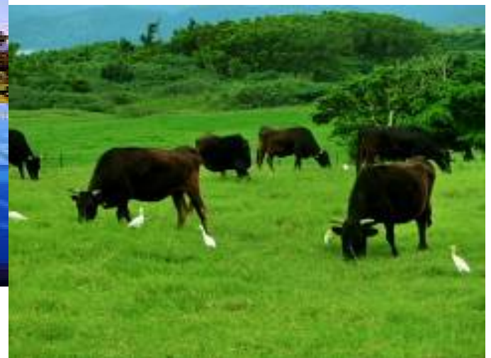
のんびりと黒牛と白鷺が沢山います。