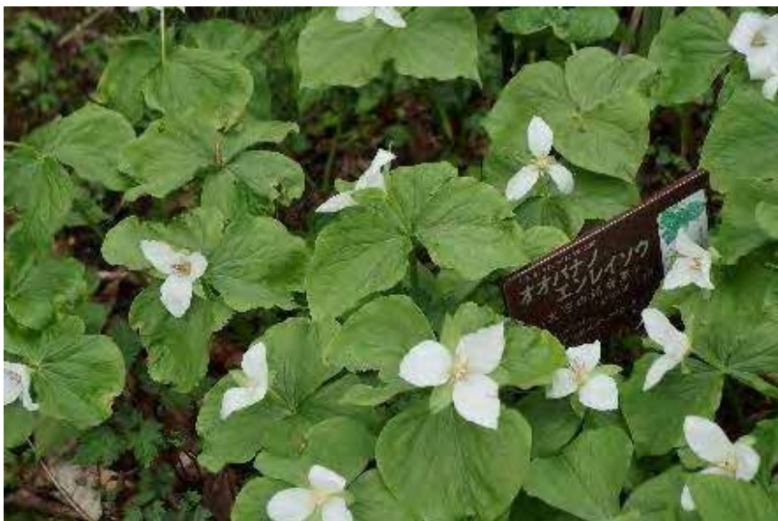
花が偏ることなく 3 方向に向かっているのがきれい (オオハナノエンレイソウ)