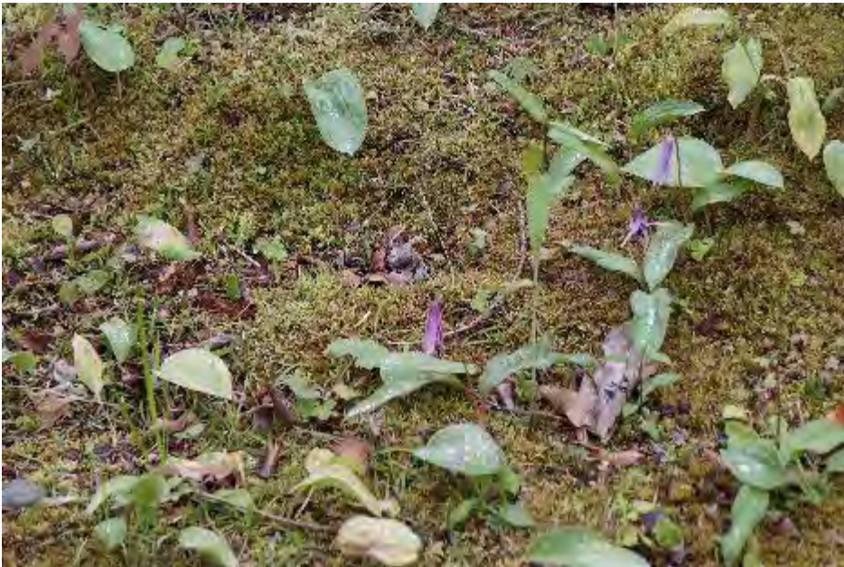
水滴を葉に残したカタクリ

久々のデジカメ倶楽部撮影会、4月中旬を過ぎていましたが水芭蕉、カタクリから山吹まで幅広い季節の花を見ることができました。