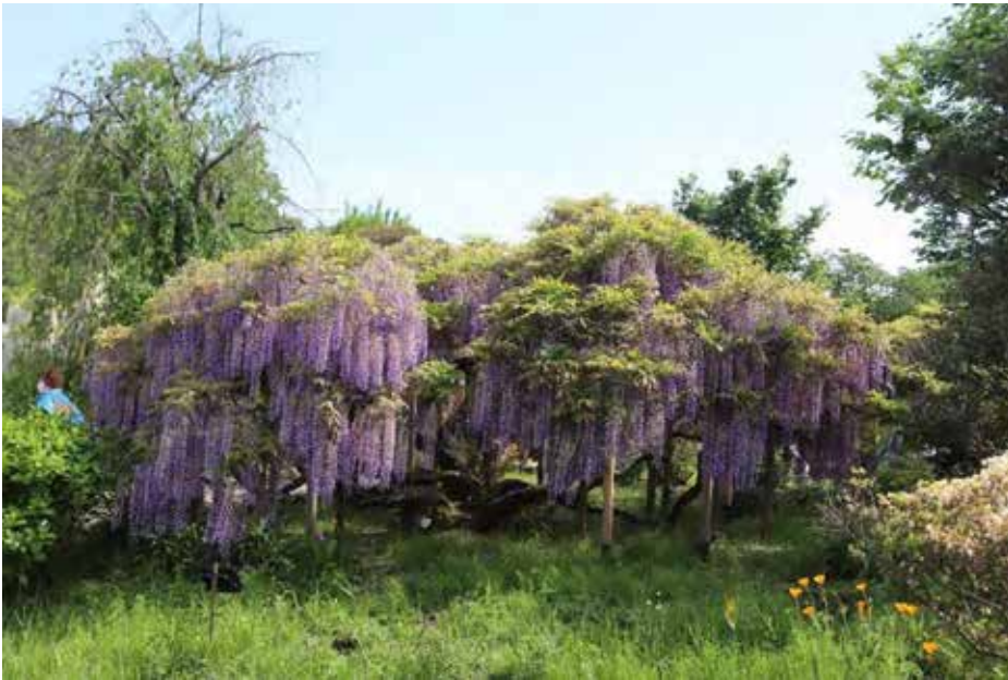
足利フラワーパーク