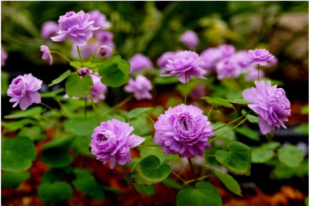
ドデカセオン(カタクリモドキ)