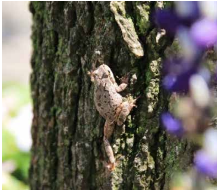
足利フラワーパーク