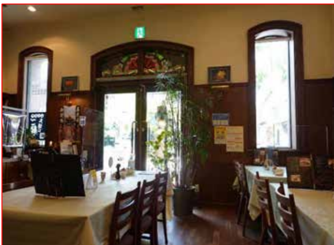
お馴染みの唐辛子の八幡屋 老夫人が営む喫茶店