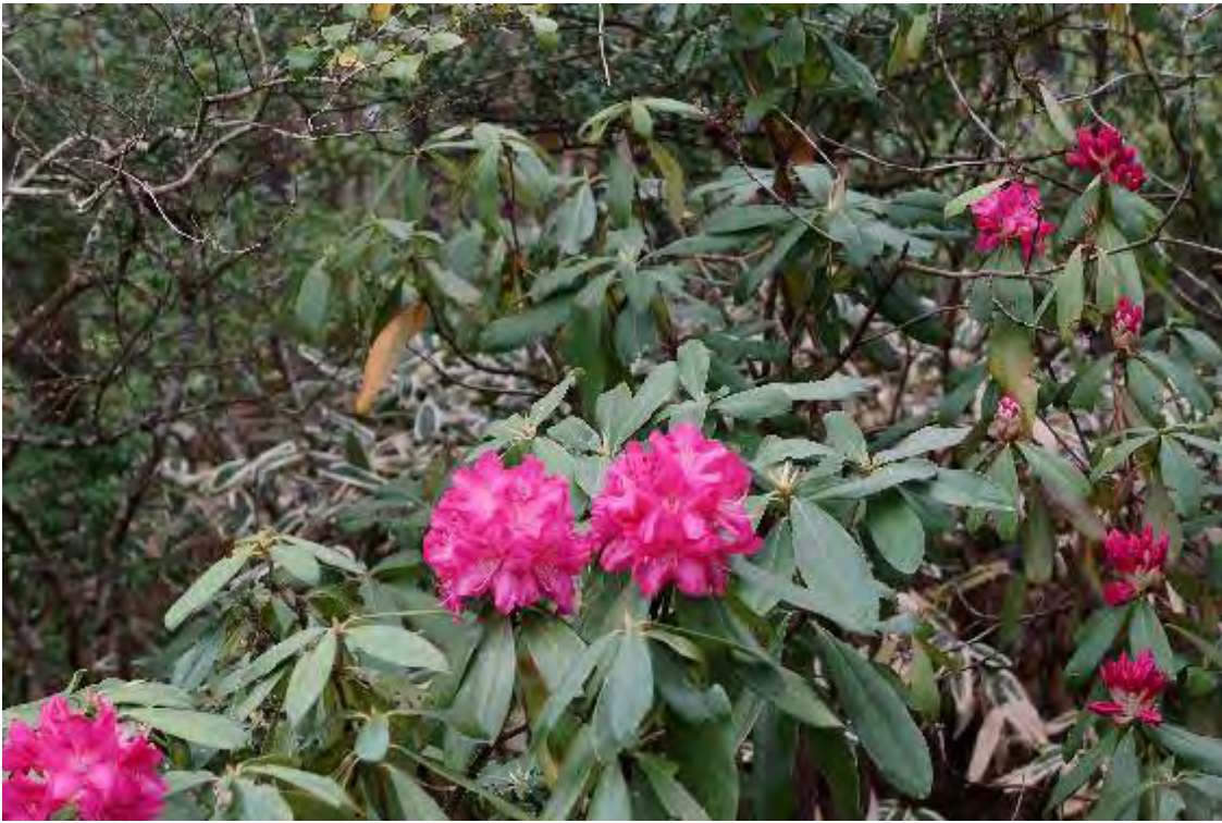
初夏の花「石楠花」は少し早咲き（西洋石楠花） 「ロゼアムエレガンス」