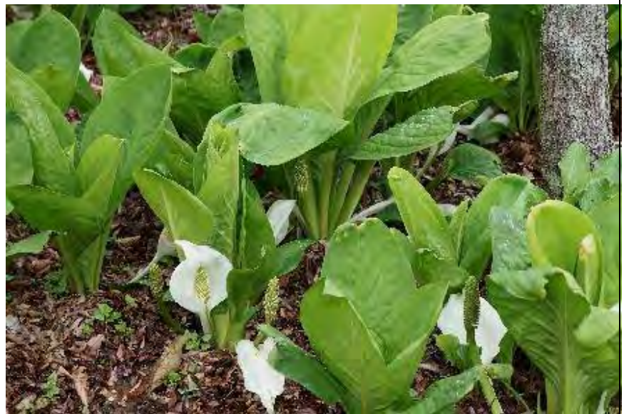
大方が咲き終え、最後に残った水芭蕉