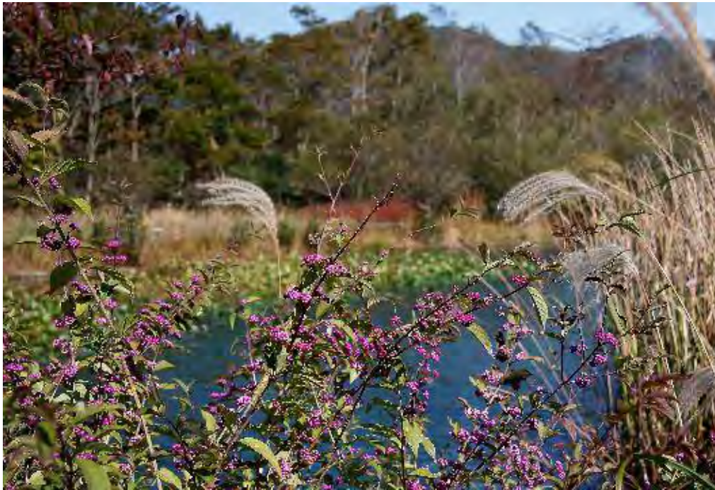
紫式部の実はその名を謳歌しています