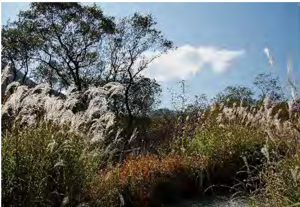
白い雲を背景にしたススキ、上の写真と風情が異なります