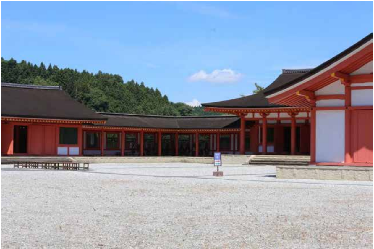
奥州 藤原の里 大河ドラマのロケ地となる