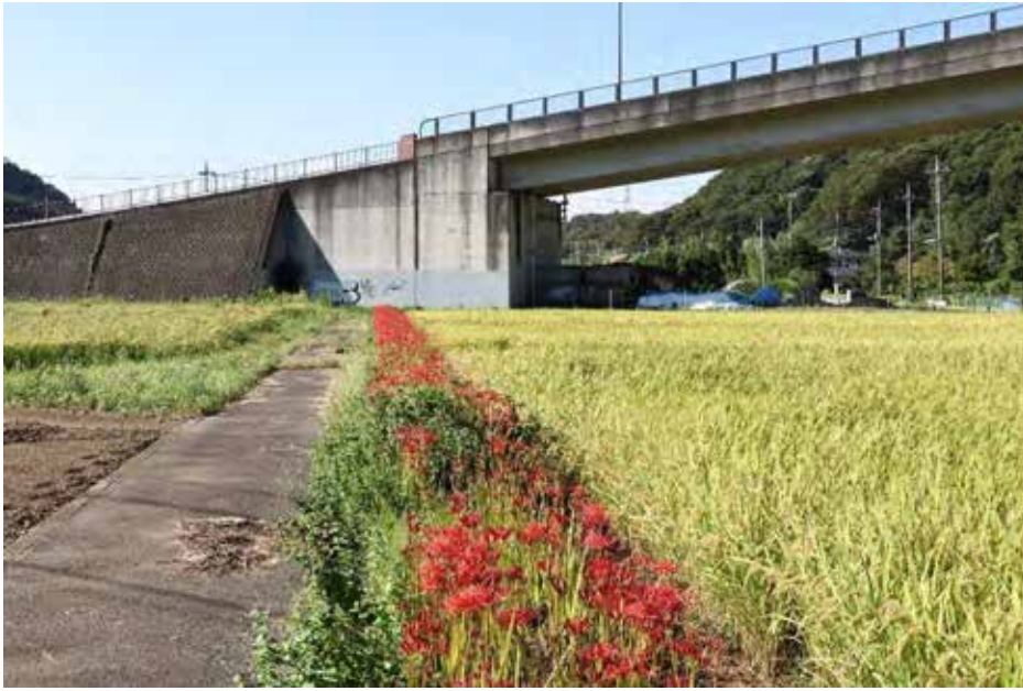
八菅大橋左側の 咲きだした彼岸花