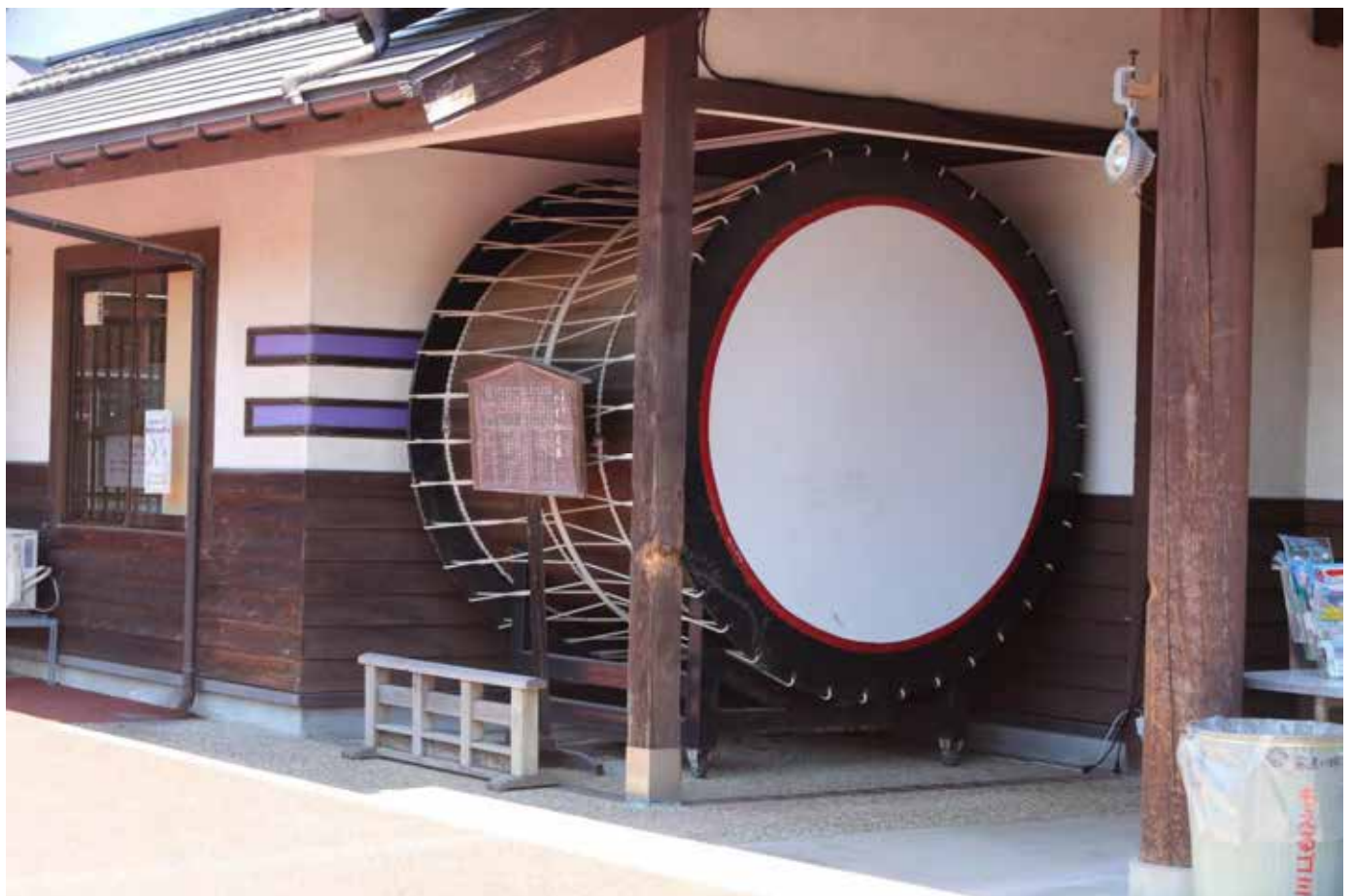
伝統芸能奥州江刺 やすわ太鼓