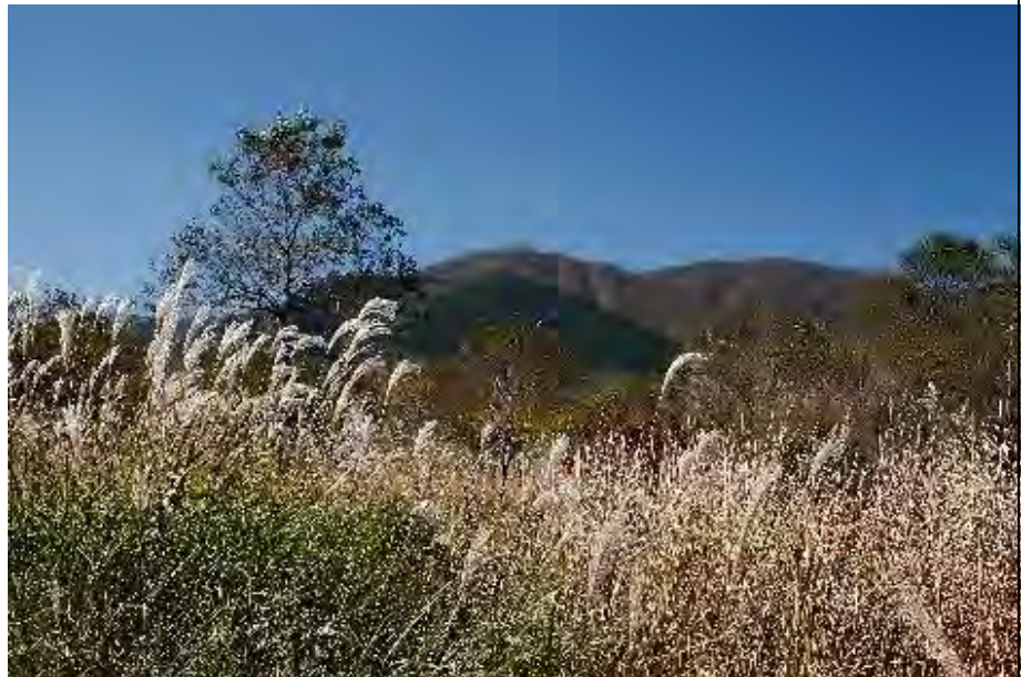
ススキも穂をそろえ始めて湿原を彩ります