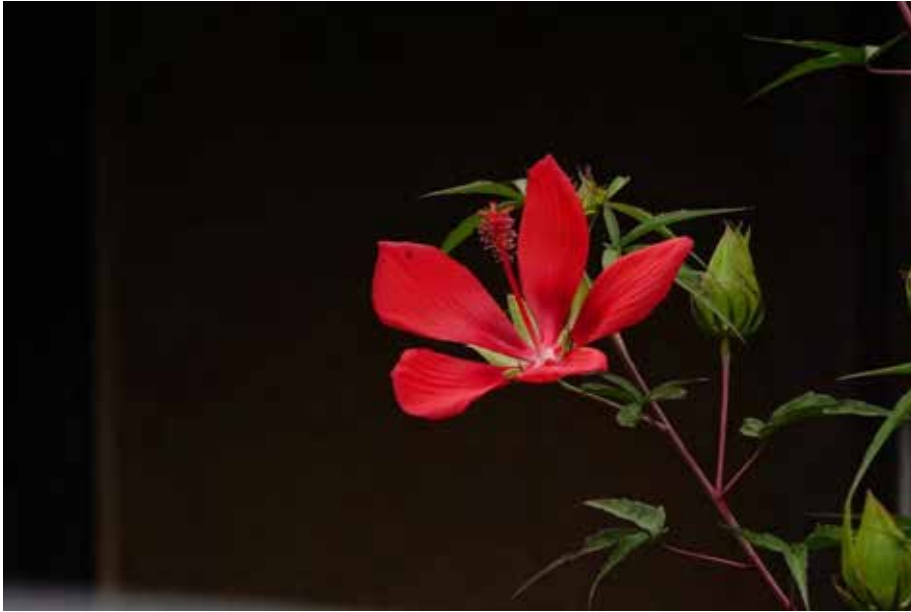
二度咲き目の モミジアオイ