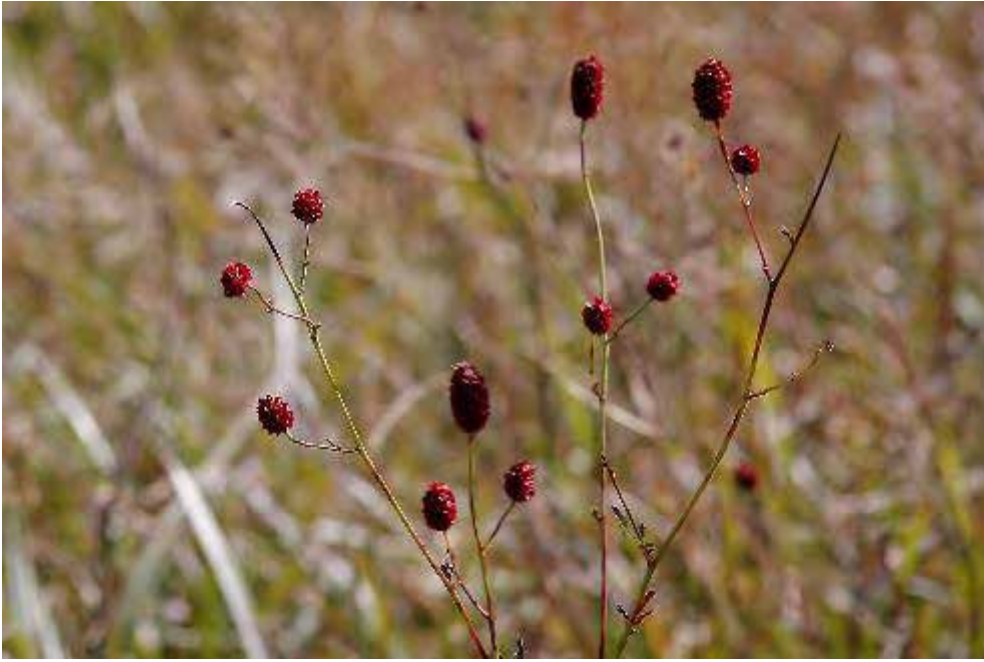
ワレモコウ (吾亦紅)