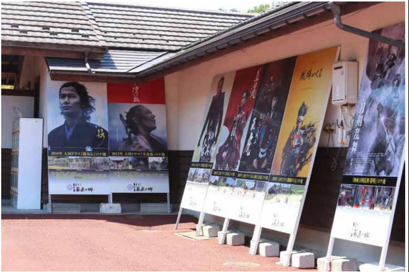
大河ドラマロケ地 平清盛・龍馬伝・真田丸・麒麟がくる おんな城主直虎 等 町人長屋（下）