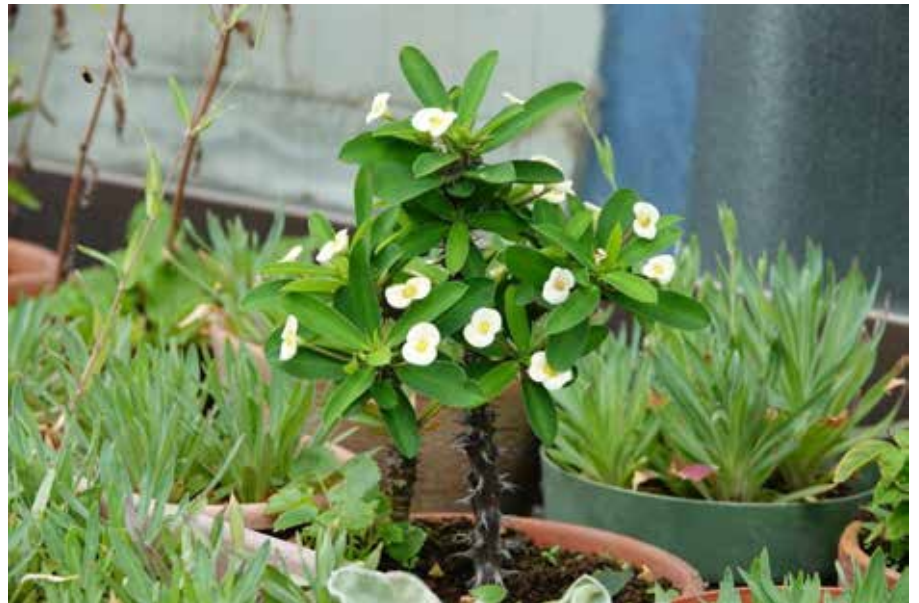
トウダイグサ科 キリンソウ