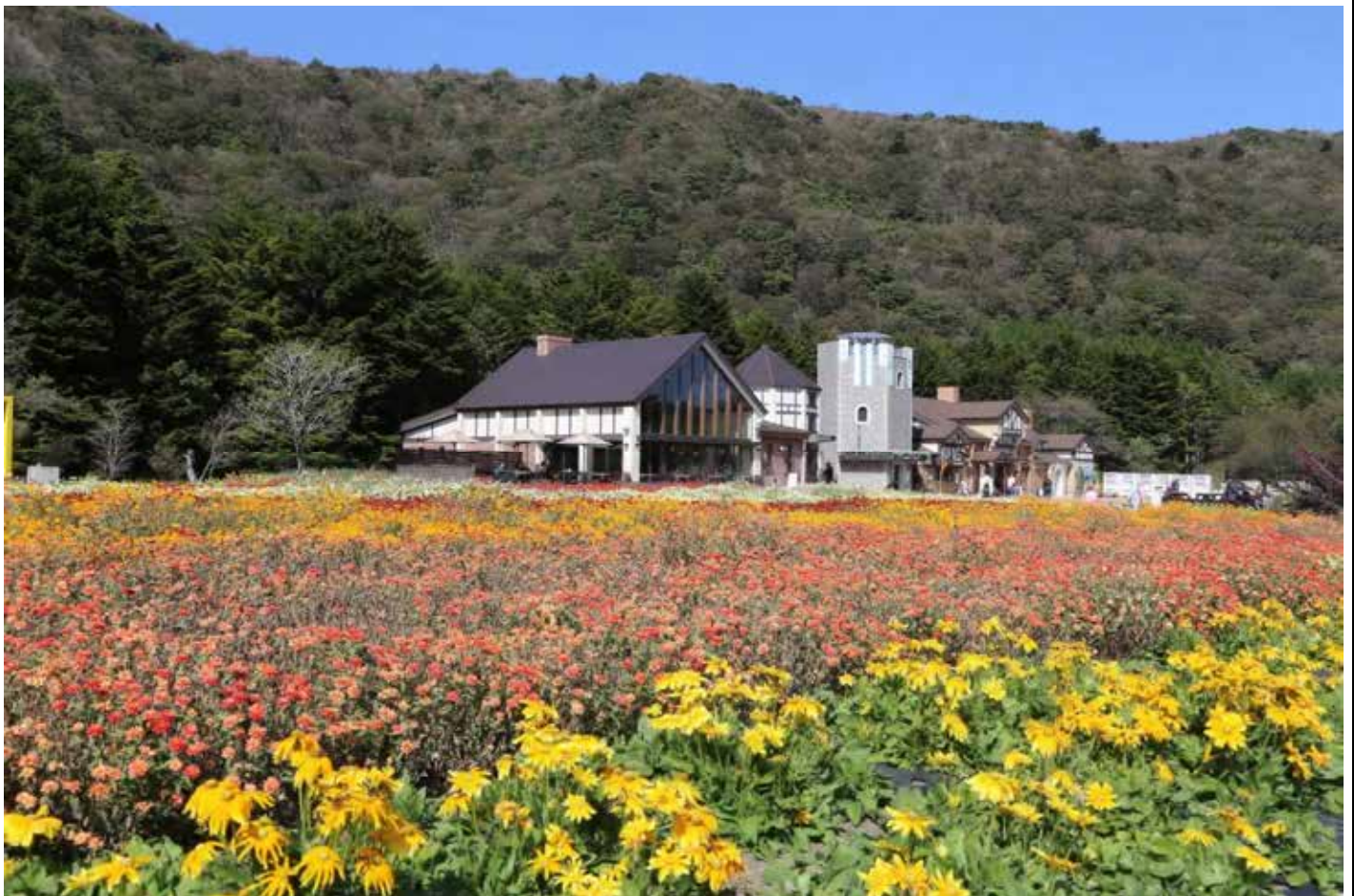
富士本栖湖リゾート 春はシバザクラで美しい