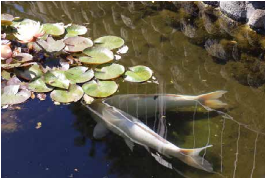
平塚 花菜ガーデン