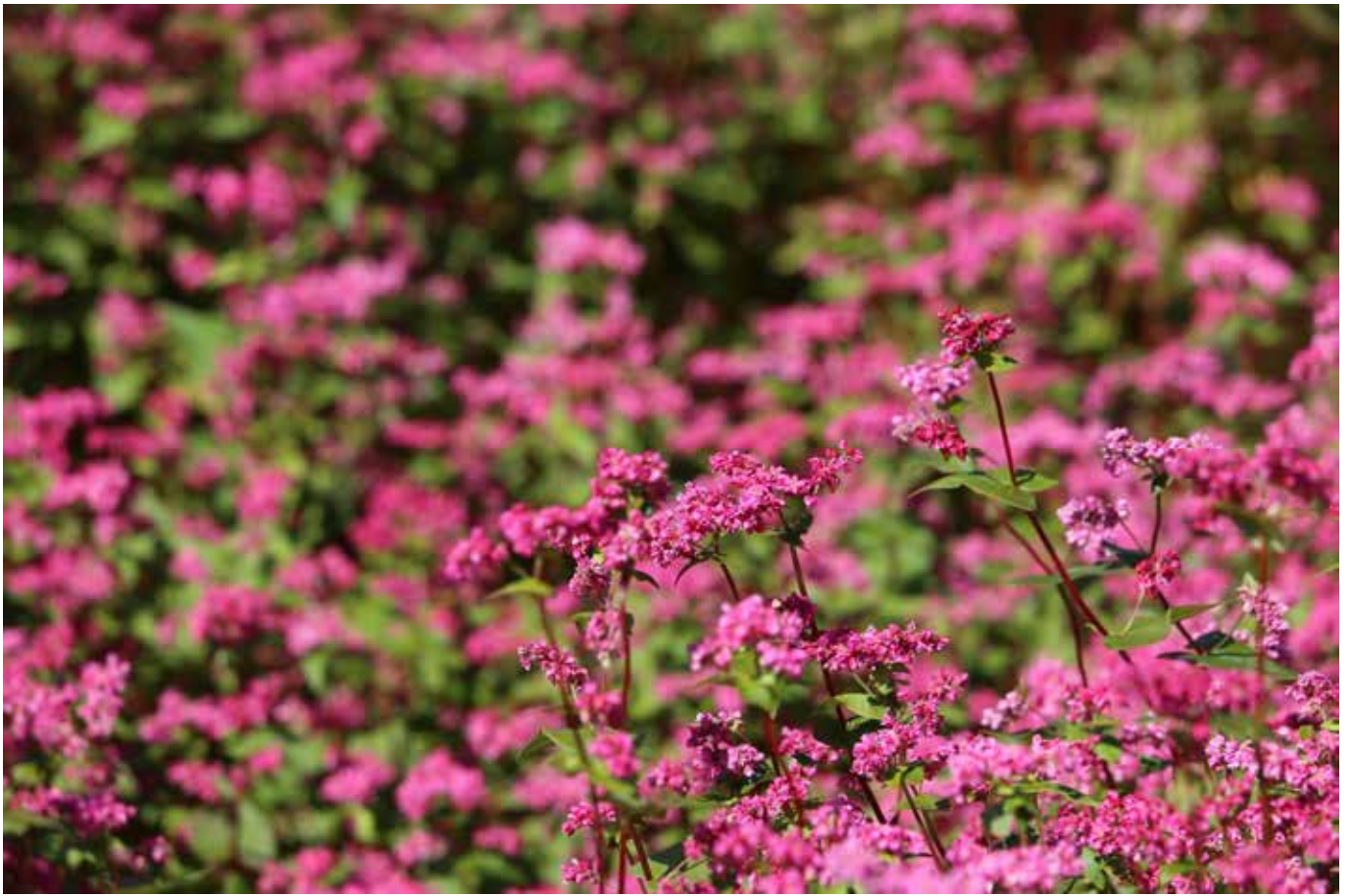
花の都公園に咲く 蕎麦と百日草