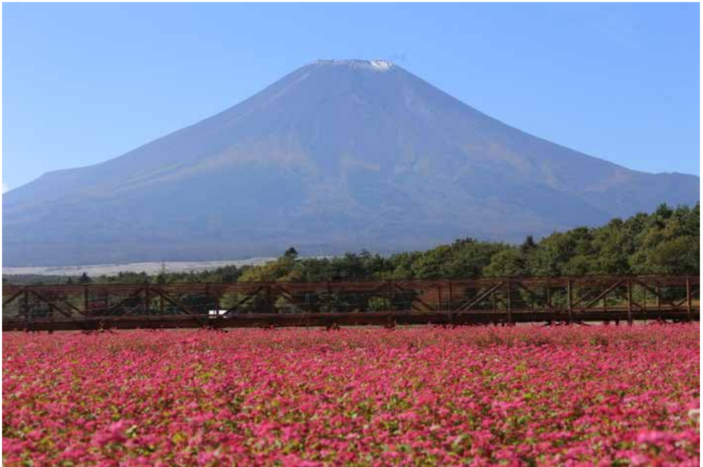
富士をバックに一面赤い蕎麦とキバナコスモス