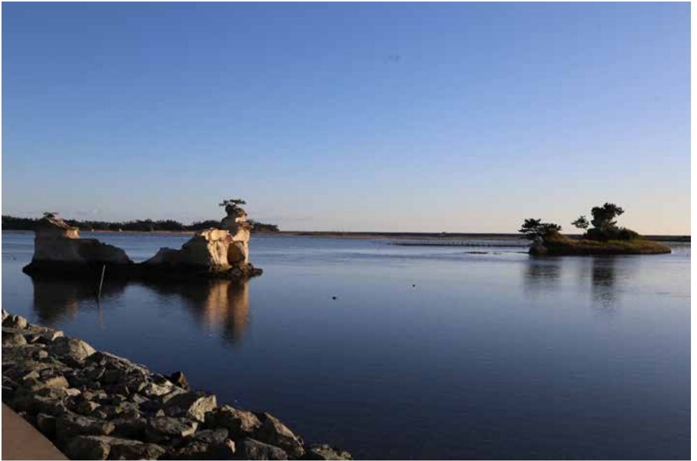
文字島の朝 漁場に向かう船