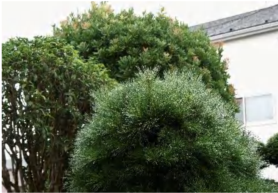
松の葉についた水滴は 数が多すぎて風情なし