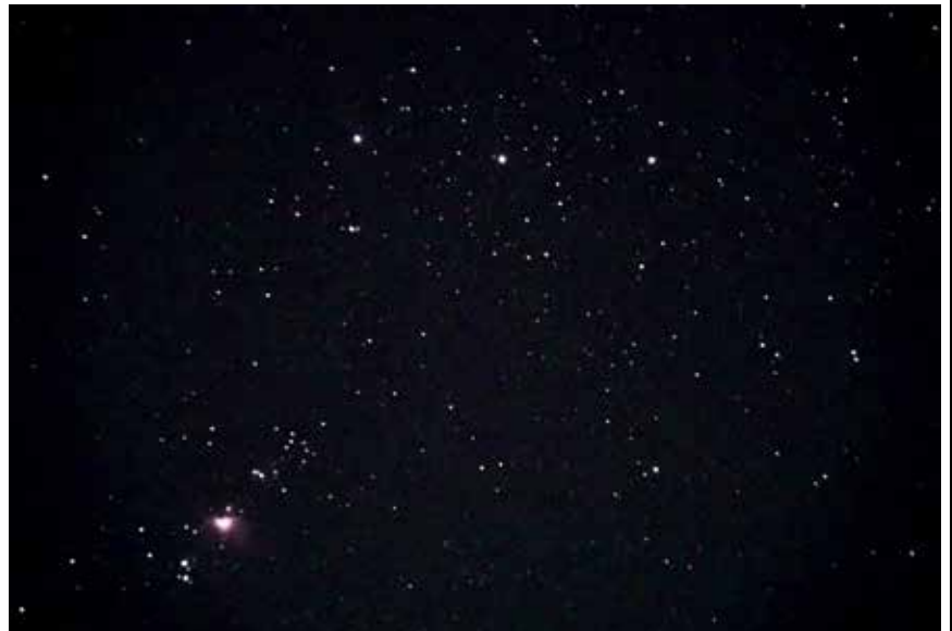
オリオン座の 三ツ星と小三ツ星