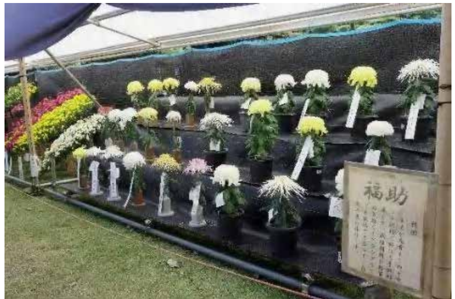
公園内で行われていた菊祭り（右、下）は福島二本松のものにはかなはない