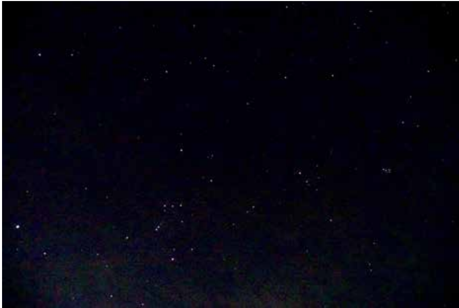
オリオン座と牡牛座