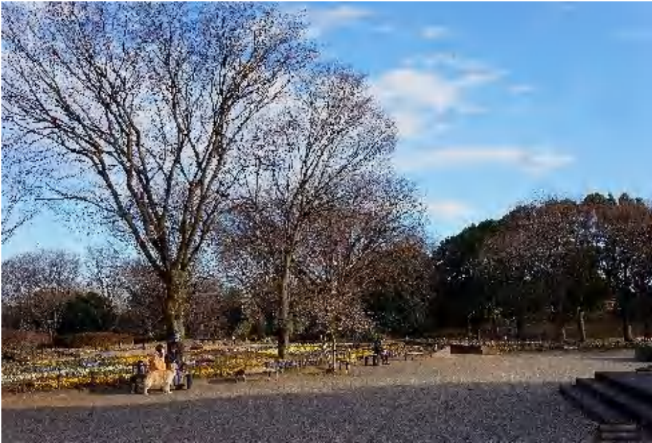
秋も深まった相模原公園、散歩する人と犬が寒さを示す