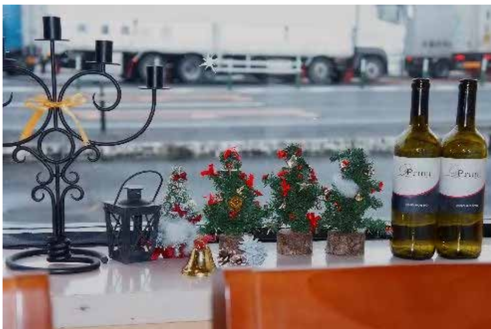
昼食で寄ったレスト ランは窓飾りが平凡