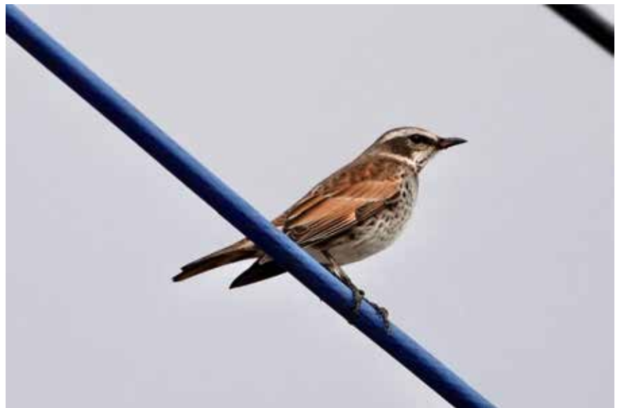
越冬で渡ってきた ツグミ