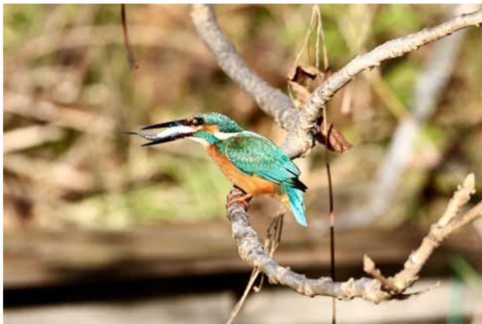
丸呑み中の カワセミ