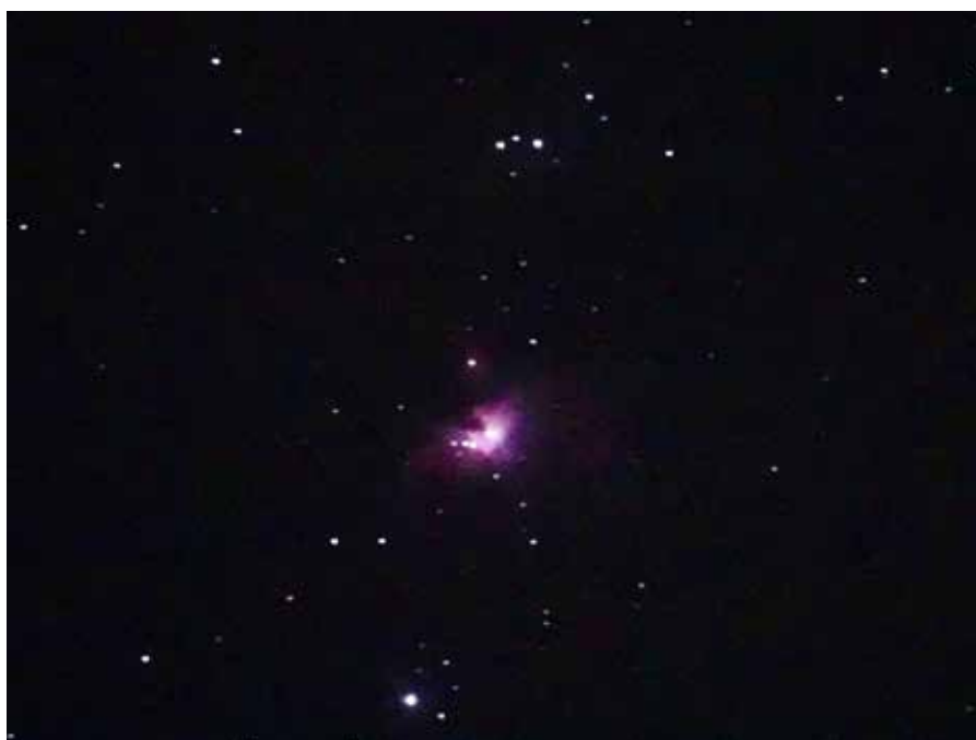
オリオン座大星雲