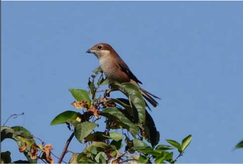
高鳴き中の 百舌鳥