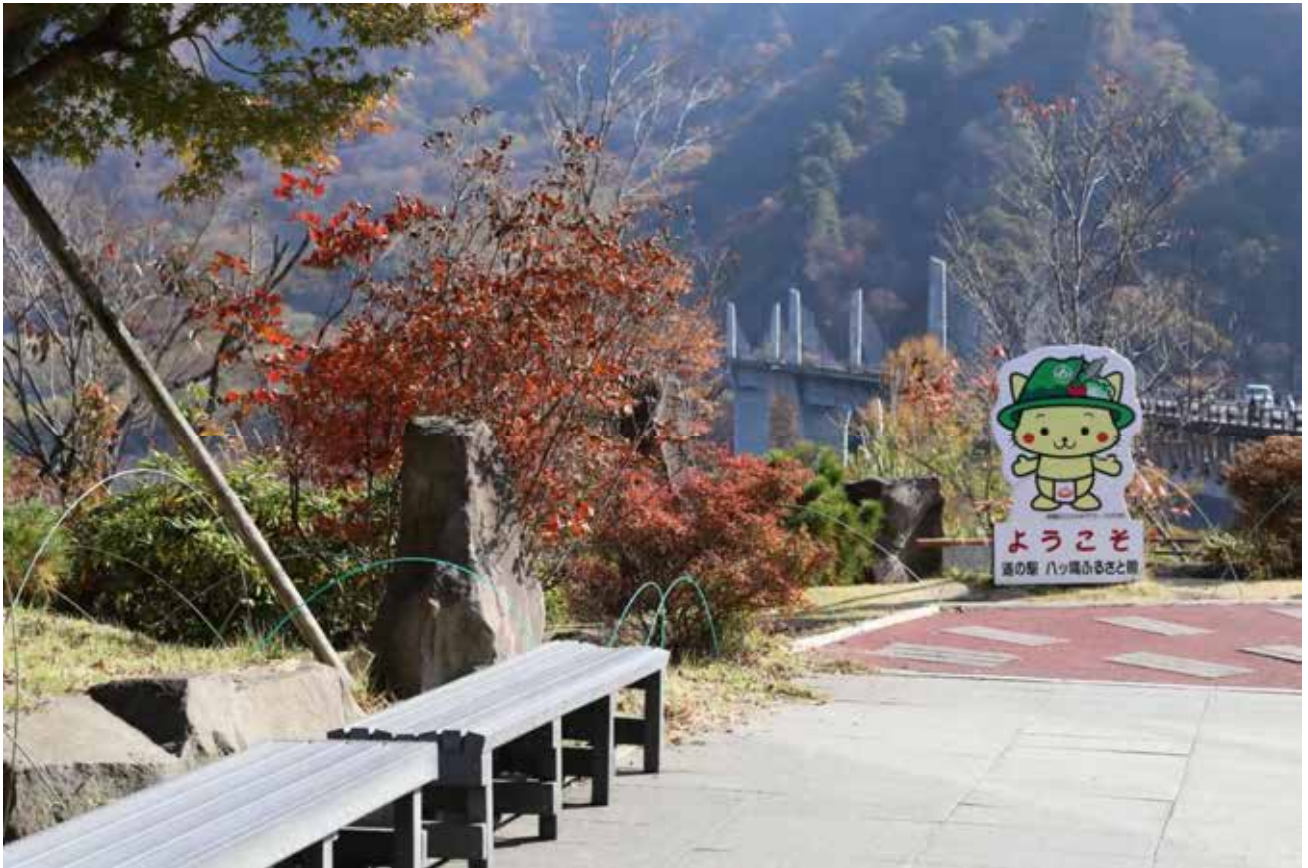
満水のハッ場ダム