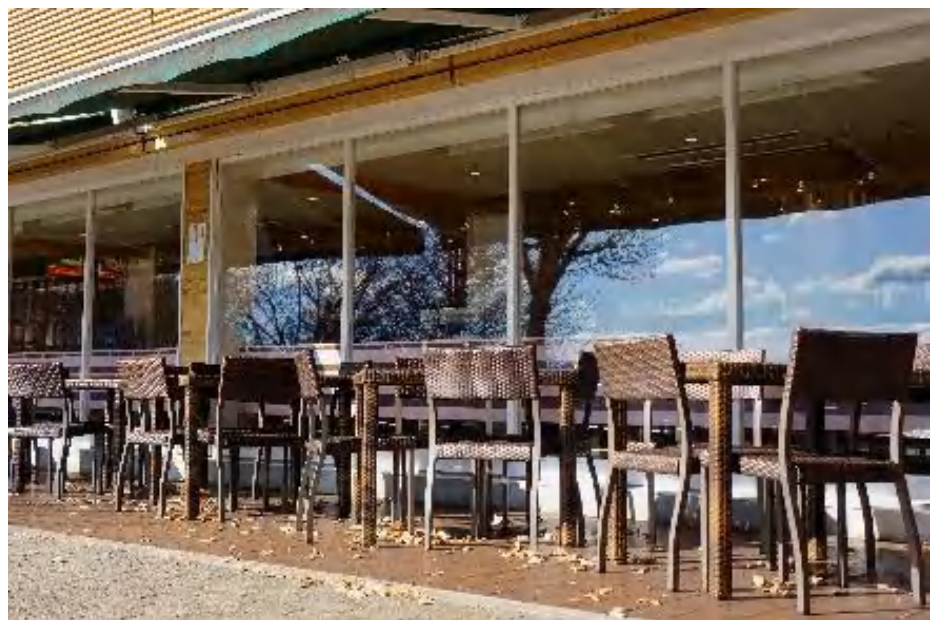
東北道のパーキングで の一コマ、床に散った落 ち葉は風情がある