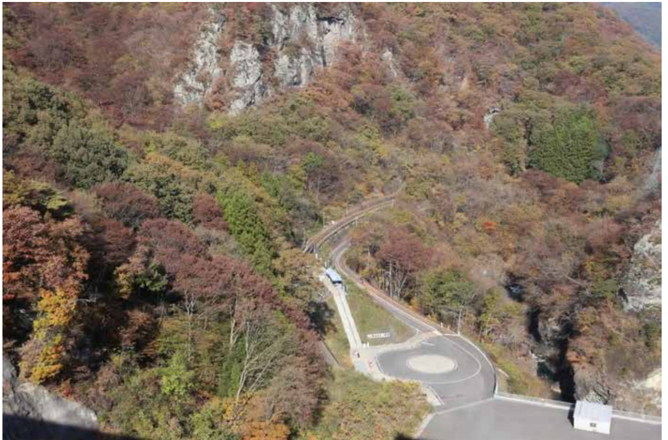
ダムに沈んだJ R 吾妻線