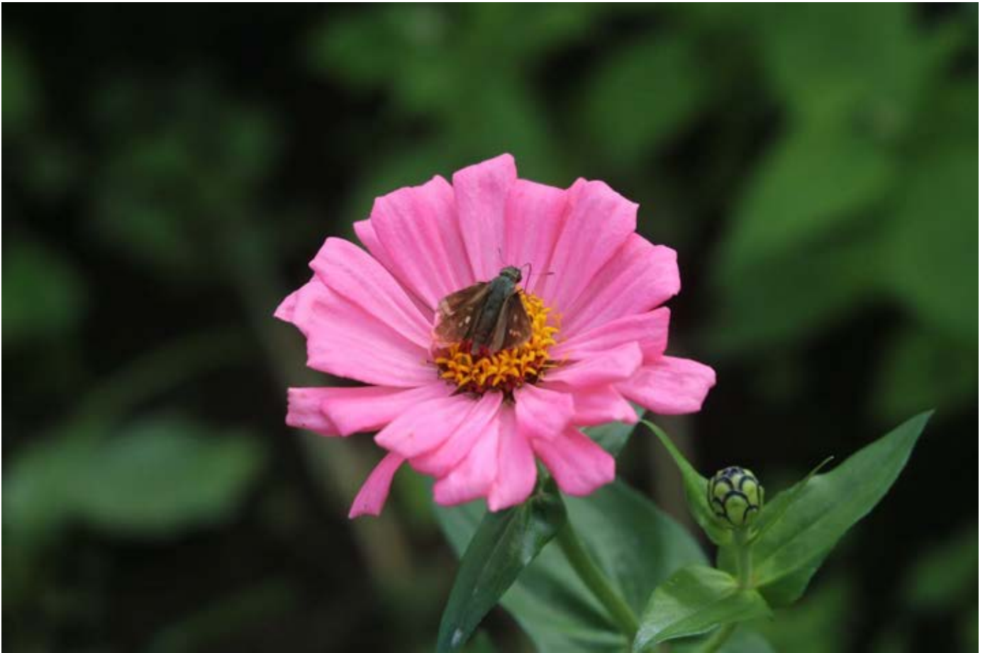
秋の花秋桜と共に百日草と向日葵が咲いて暑い!!