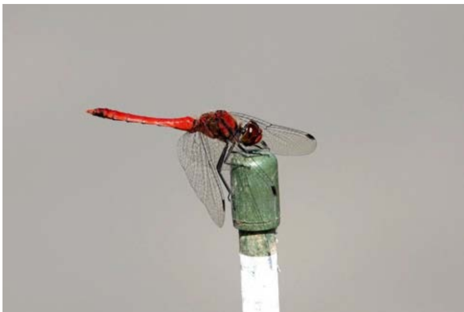
陽だまりを浴びる アキアカネ