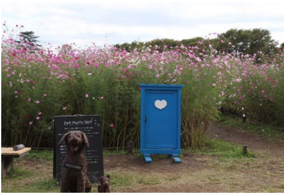
国営昭和記念公園： コスモス