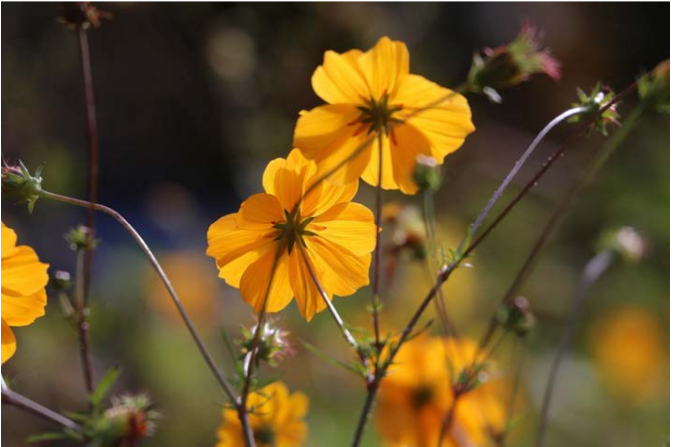
キバナコスモスと紫秋桜