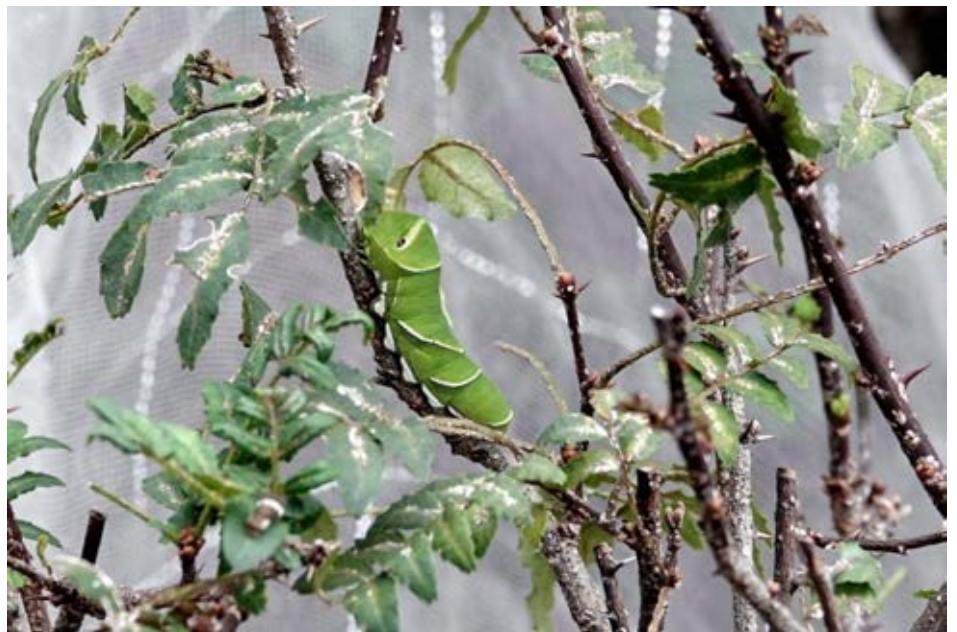
山椒の葉と アゲハ蝶の青虫