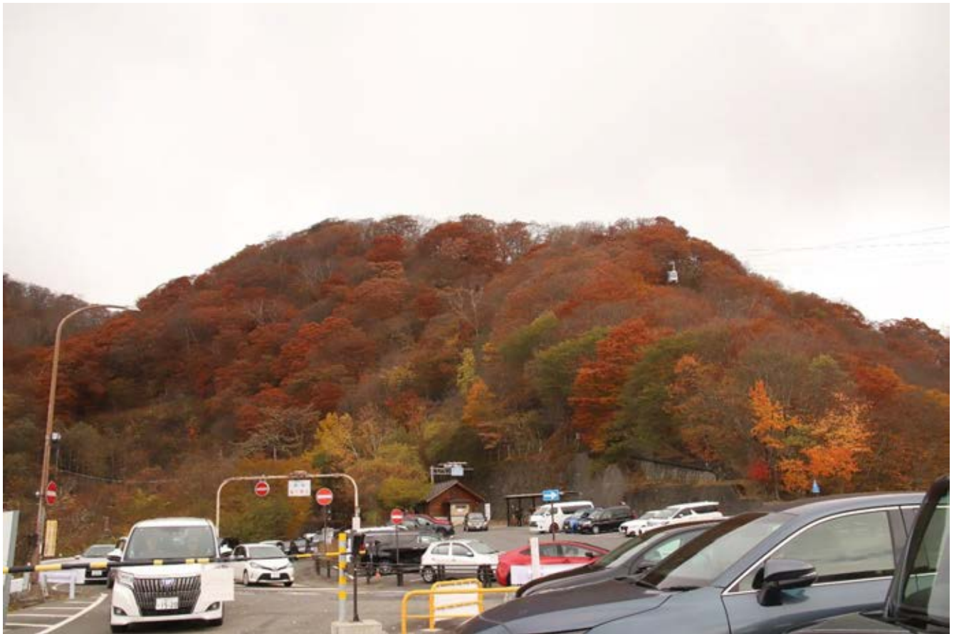
上： 日光 明知平 ロープウェイ 下： 日光 戦場ヶ原