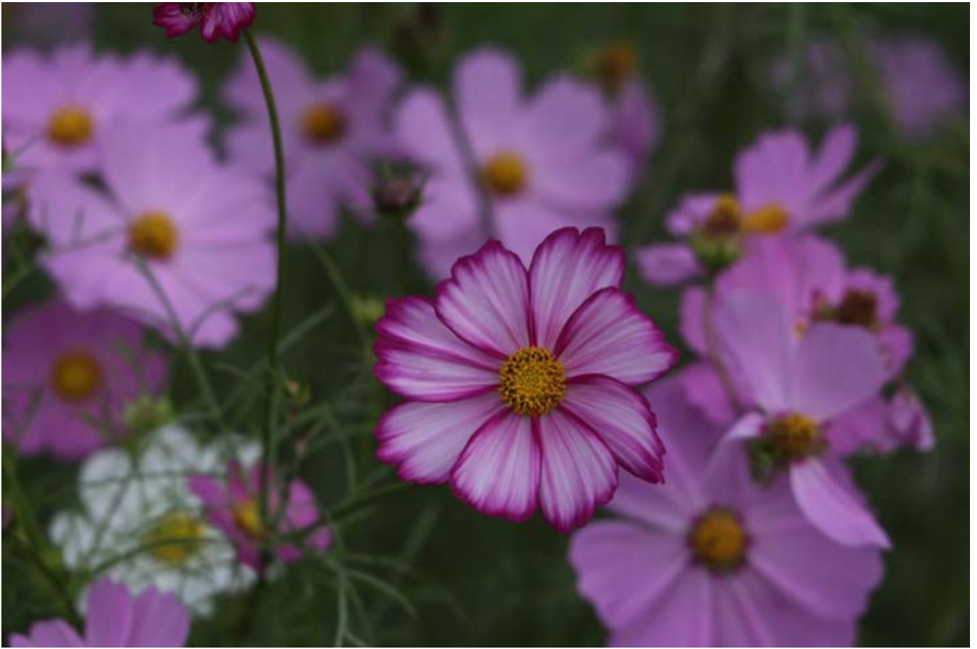
コスモス kosmos(ギリシャ)・cosmos(イギリス)美しい秩序と調和