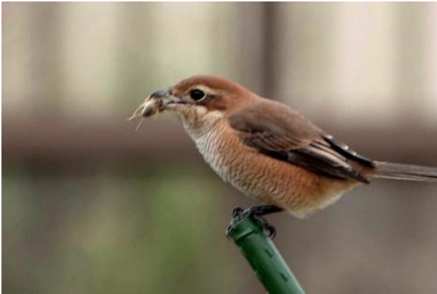
コオロギを 捉えたモズ