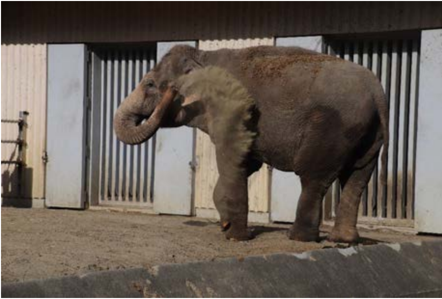
横浜 金沢動物園 象さんが砂浴びして いました