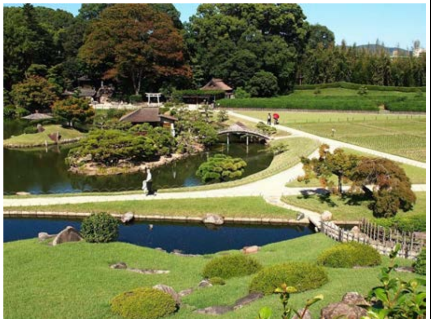
沢の池に中の島と御野島