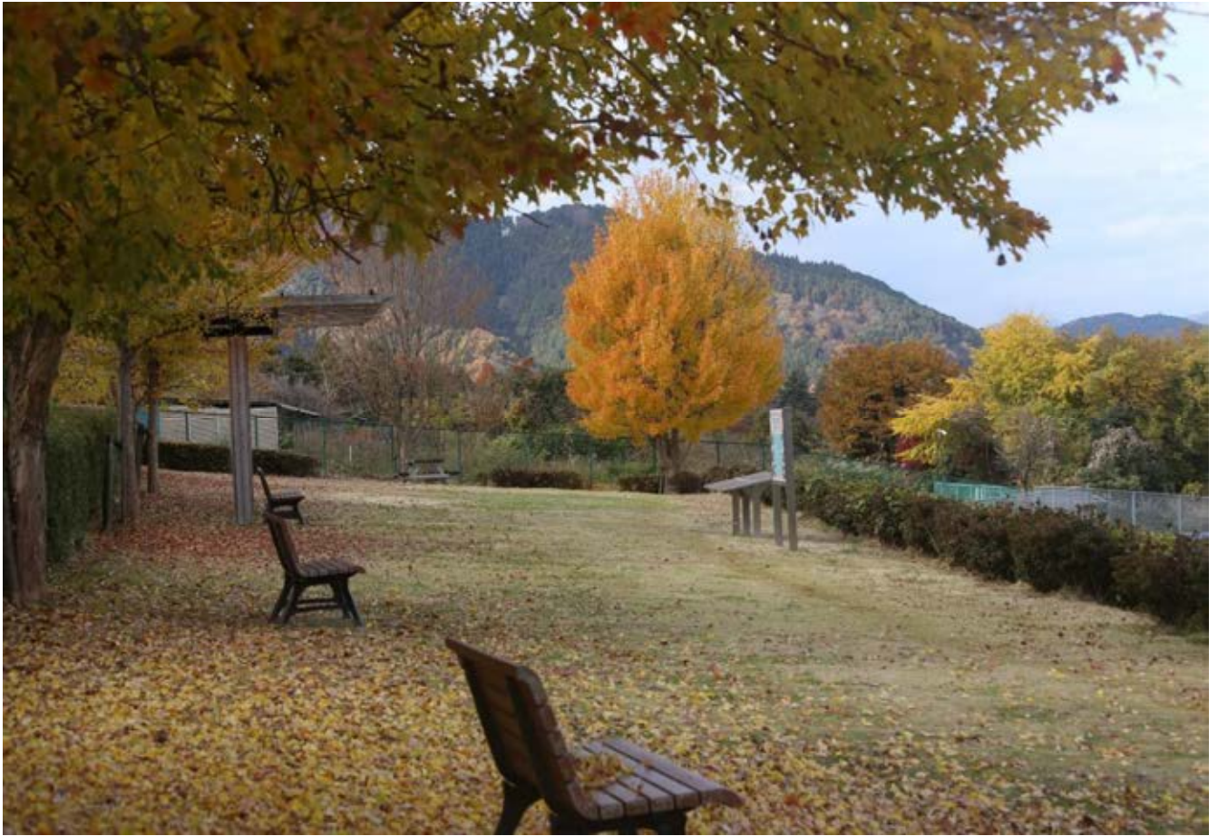
太陽光パネルと落ち葉の絨毯の散歩路