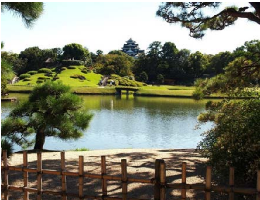
慈眼堂より沢の池を観る