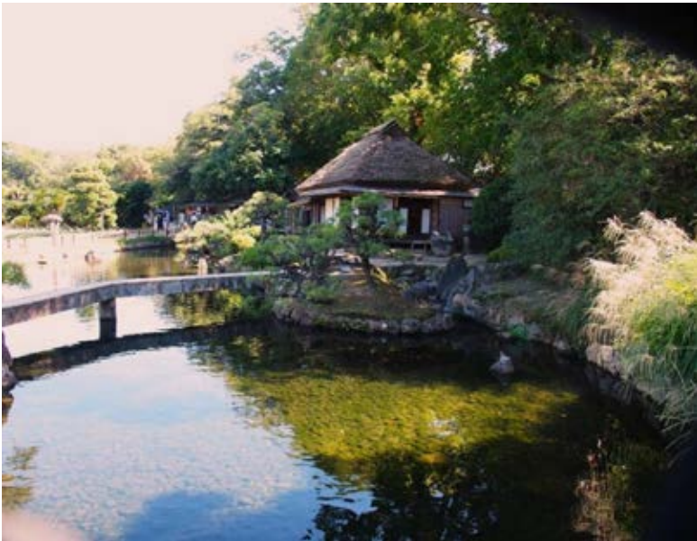
簾池軒（れんちけん）