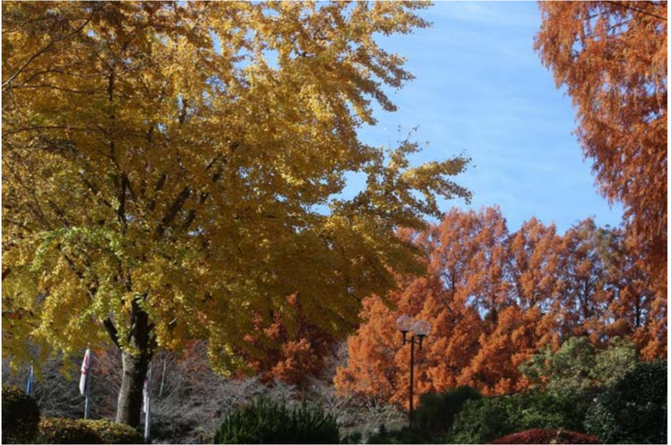
銀杏とメタセコイアの紅葉