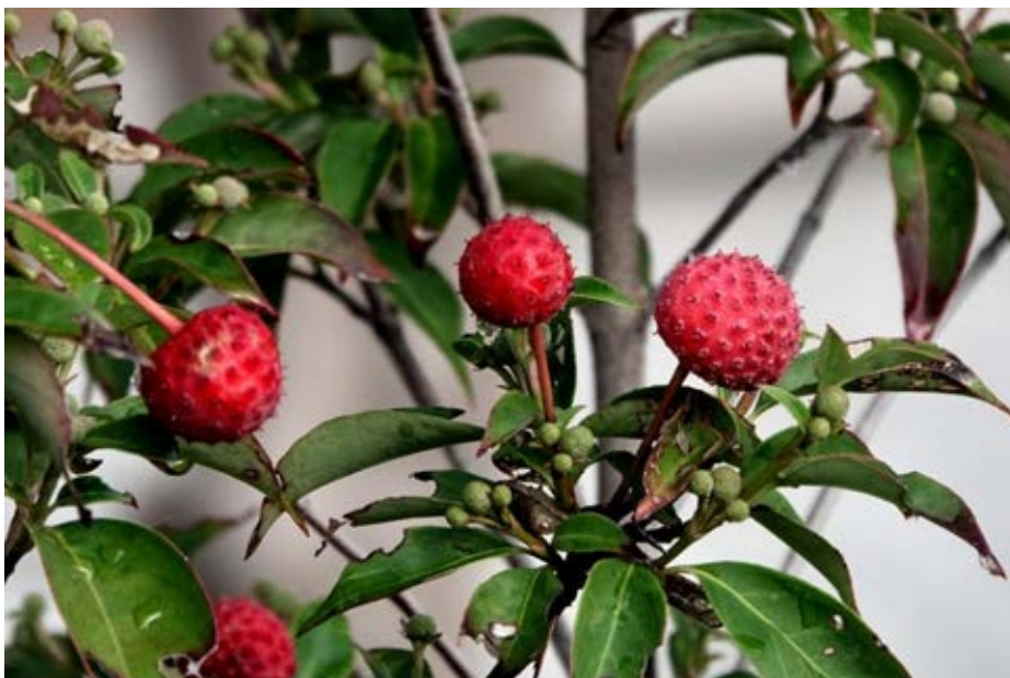
常緑ヤマボウシ の実