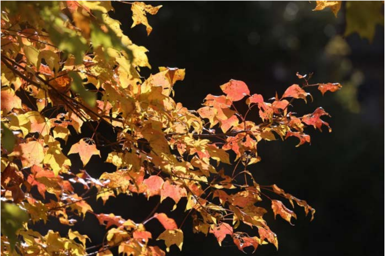
唐楓・銀杏の紅葉